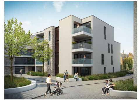
Maalderijstraatje 2, 10, 11, 12 - 2800 Mechelen